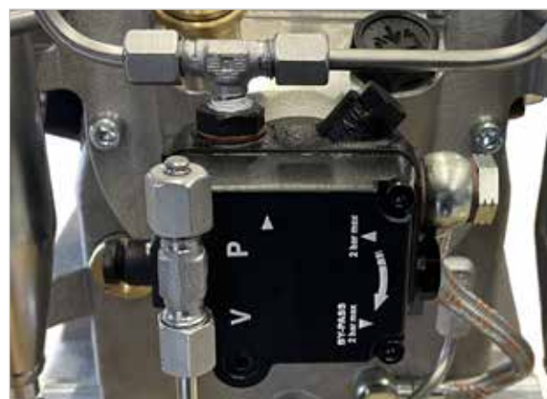
NUEVO - Bomba de aceite regulable con tamiz de aceite